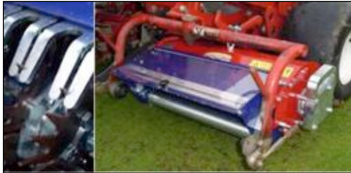
Maredo GT 410 –paikkokylvin