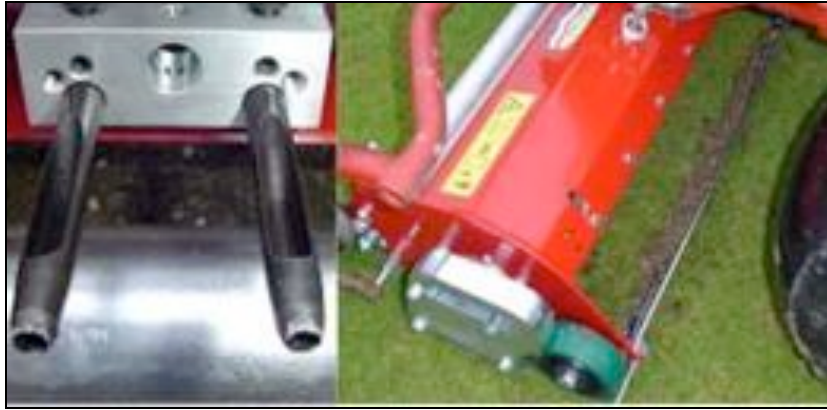
Maredo GT 230 –vibraholkki-ilmastin