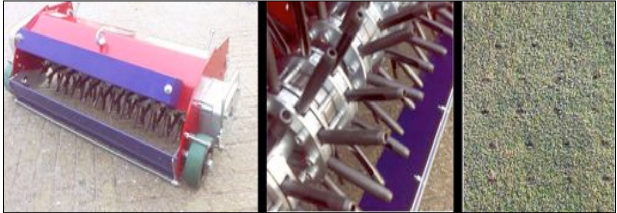
Maredo GT 220 –vibrarumpuholkki-ilmastin