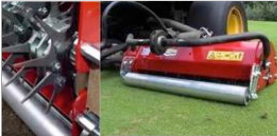
Maredo GT 219 –vibratähti-ilmastin