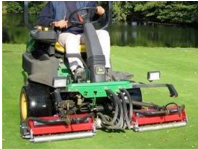
Maredo GT 200 -pystyleikkuri