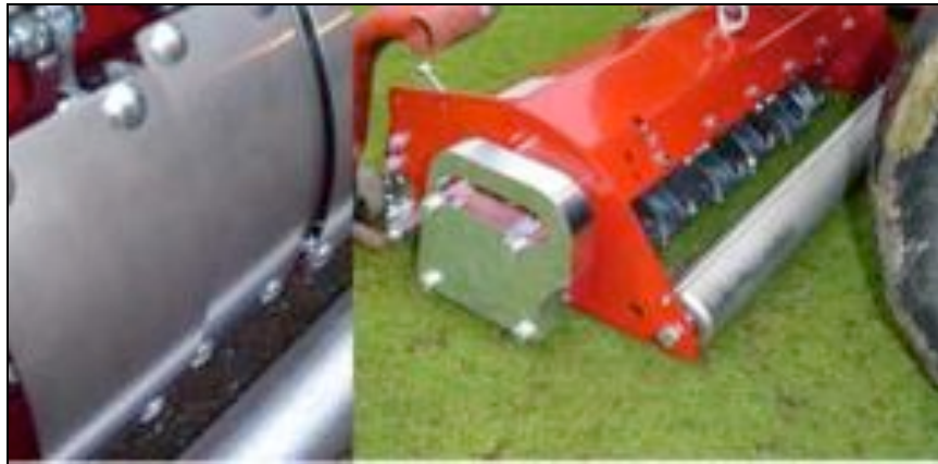
Maredo GT 300 –vibraajyvä