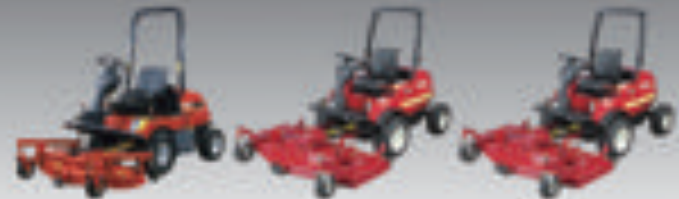
CM214 24 hp/ (17.6 kW)

Kun puhutaan helposta huollettavuudesta silloin Shibaura on oikea valinta! Moottoriöljyn tarkistus, suodattimen vaihto ja muut päivittäiset huoltokohteet ovat helposti löydettävissä moottorin yhdeltä sivulta.